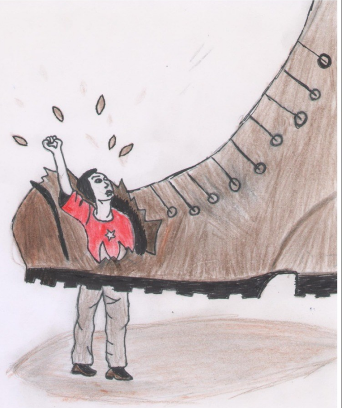
Elif KIZILARSLAN 6/A