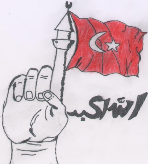
Elif KIZILARSLAN 6/A